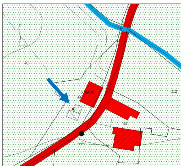
Tavola D1 vigente